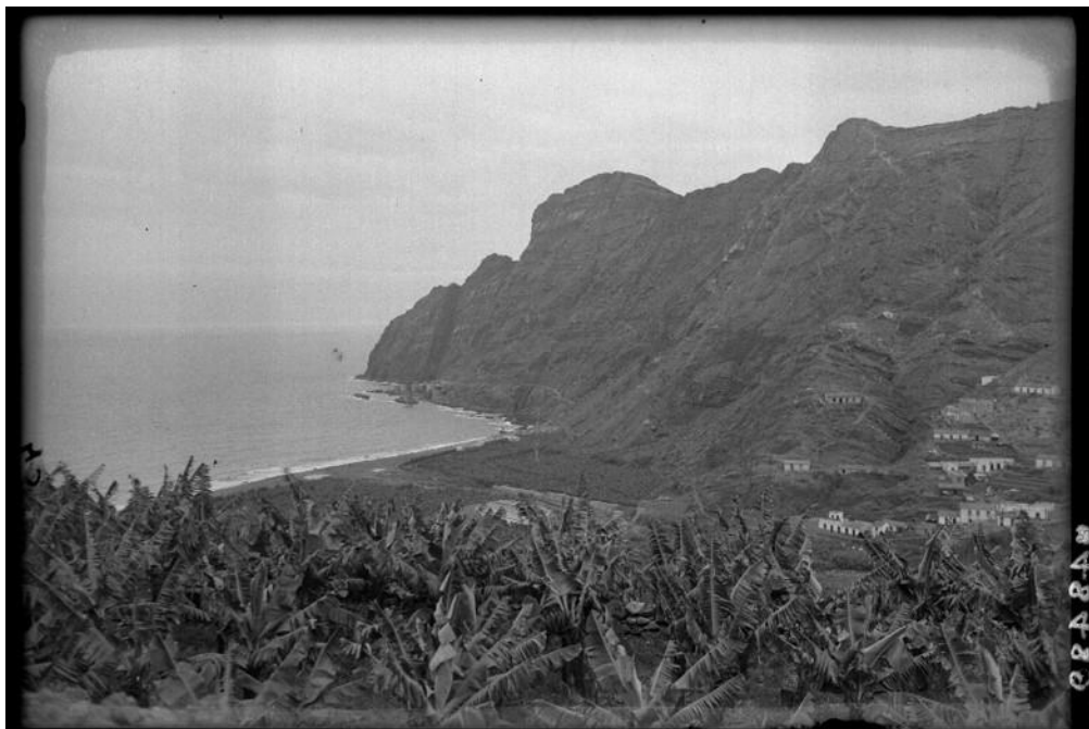
Desarrollo de la platanera en Hermigua. Año 1933.