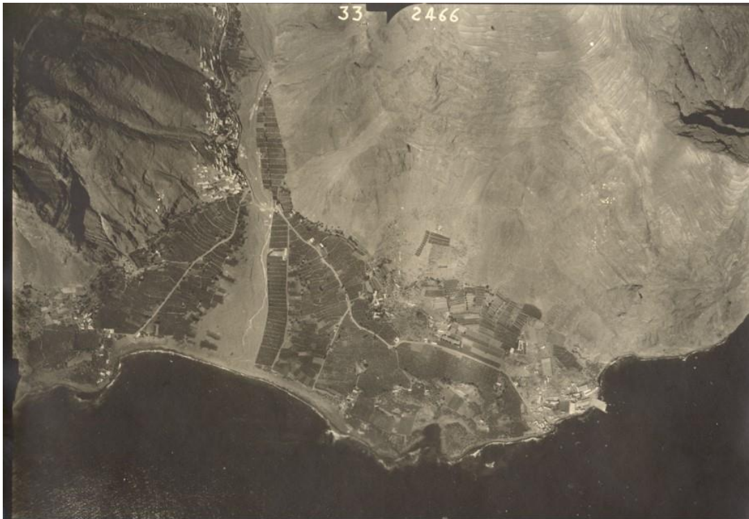
Desarrollo de la platanera en Valle Gran Rey. Año 1957.