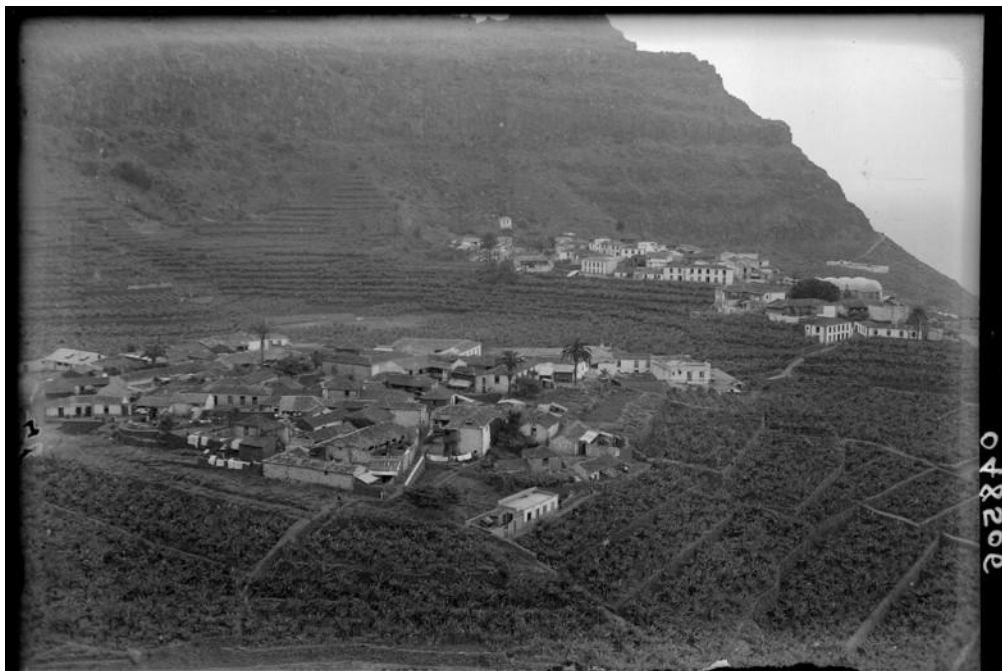
Desarrollo de la platanera en Agulo. Año 1933.

agruparon todas las comunidades del municipio (Comunidad de Regantes de Agulo y barranco de La Palmita, Comunidad de Regantes de Lepe, Comunidad de Regantes de Piedra Gorda y Barranco de Las Rosas), dando lugar a la “Comunidad de Regantes de Agulo”.