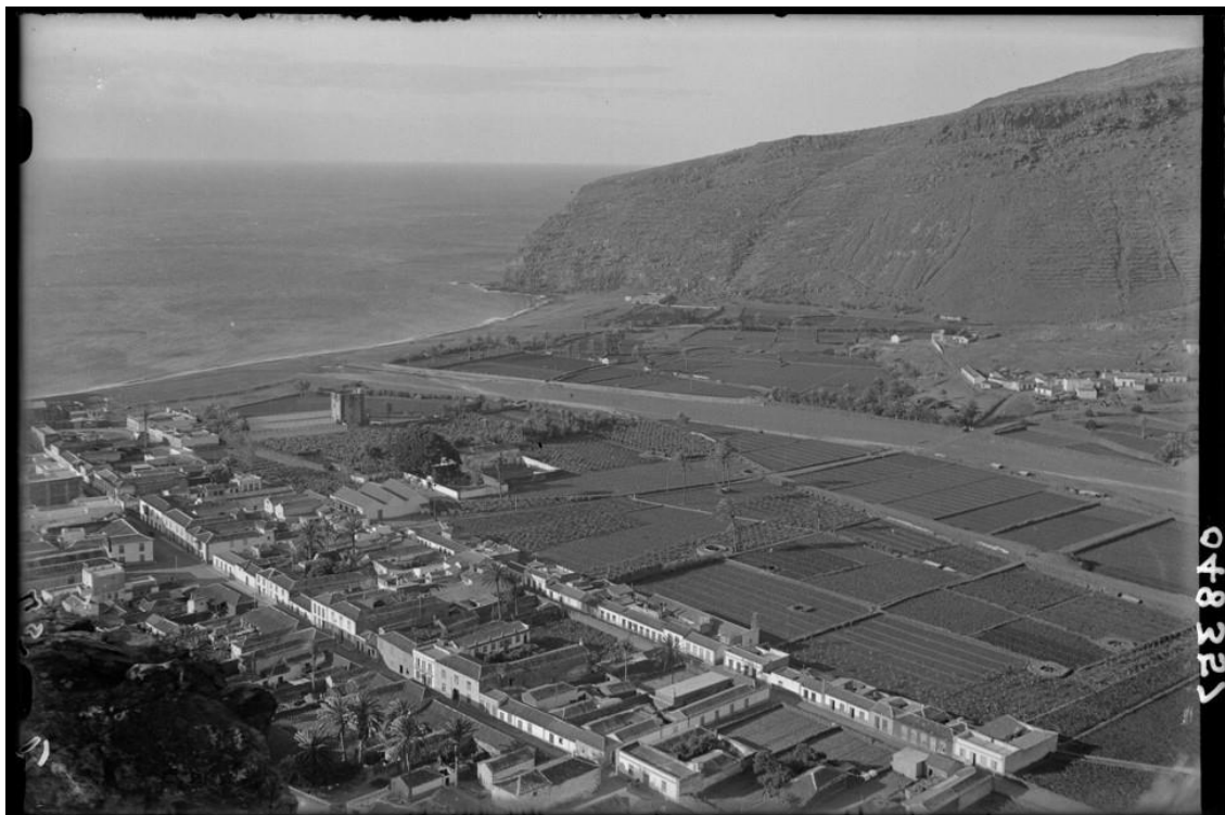
Desarrollo del regadío en San Sebastián. Año 1933.

El tratamiento conjunto que hacemos de San Sebastián y Alajero se debe a lo ocurrido en la comarca de Playa de Santiago, compartida por ambos municipios y cuya columna vertebral lo constituye el barranco de Santiago. Aquí también el régimen de riego se vio trastocado, pero, lo más importante a señalar, fue el proceso de apropiación del agua en manos de unos pocos agentes (capital comprador local y capital noruego) que adquirieron grandes extensiones de tierra en las primeras décadas del siglo XX.