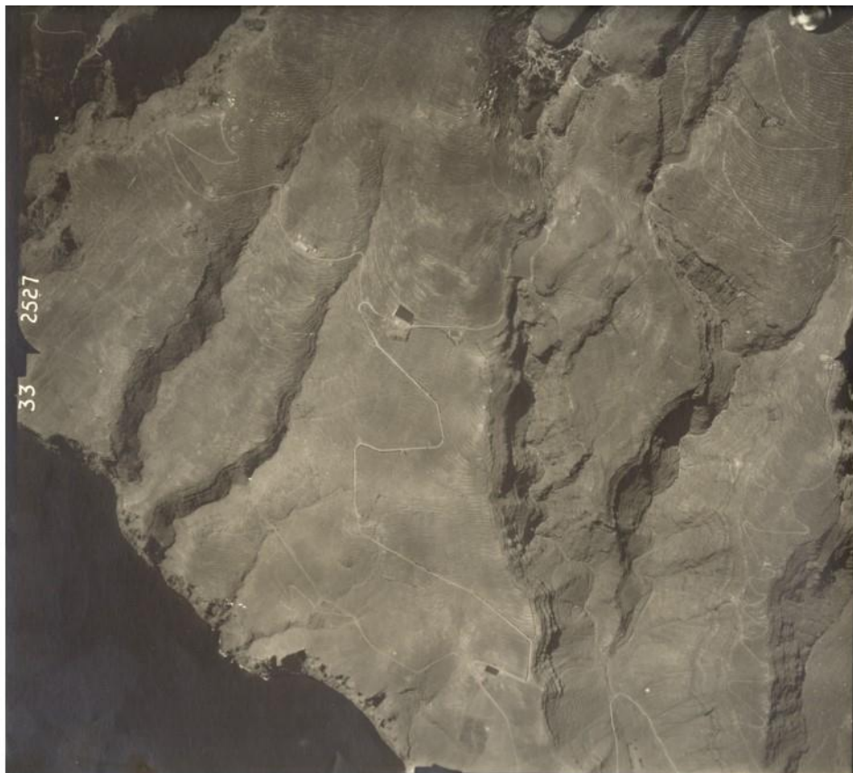
Bandas de Alajeró, lomas que se regaron con el agua proveniente del barranco de Imada. Año 1957.